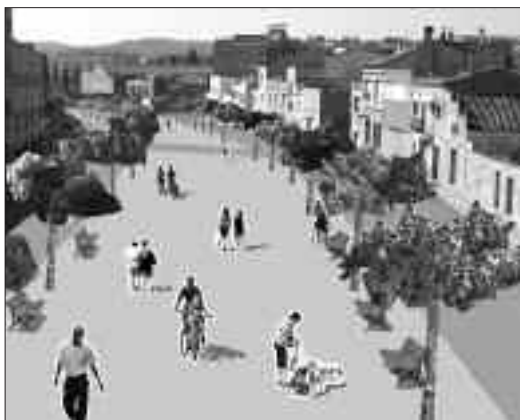
Proposta de l'ENTESA

L'Entesa va proposar el soterrament amb dos objectius: eliminar la barrera que representen les vies i evitar l'enderroc d'una vintena d'edificis al barri de Gràcia que el projecte condemnava. A més, el soterrament tindria altres avantatges: