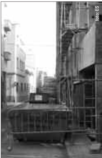
C. de Portugal