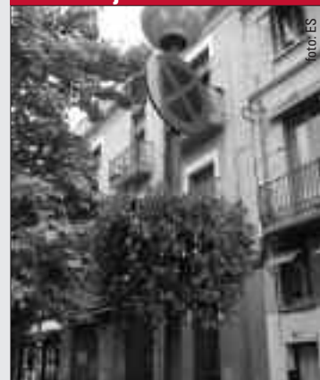
C. de la Salut

El pressupost municipal per a les floretes és inacabable. No tan sols s'han destinat 310.660 € per penjar adornaments florals als fanals d'algunes avingudes, sinó que ara s'ha adjudicat el manteniment d'aquests adornaments per un període de 2 anys per un import de 480.000 €.