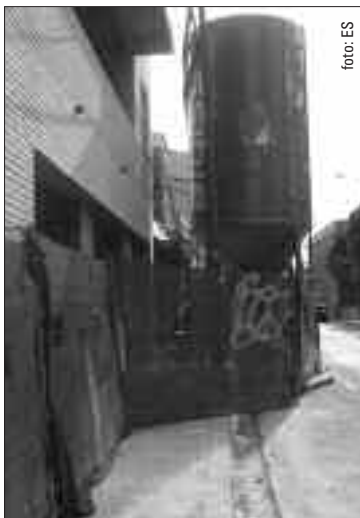
C. de Viladomat