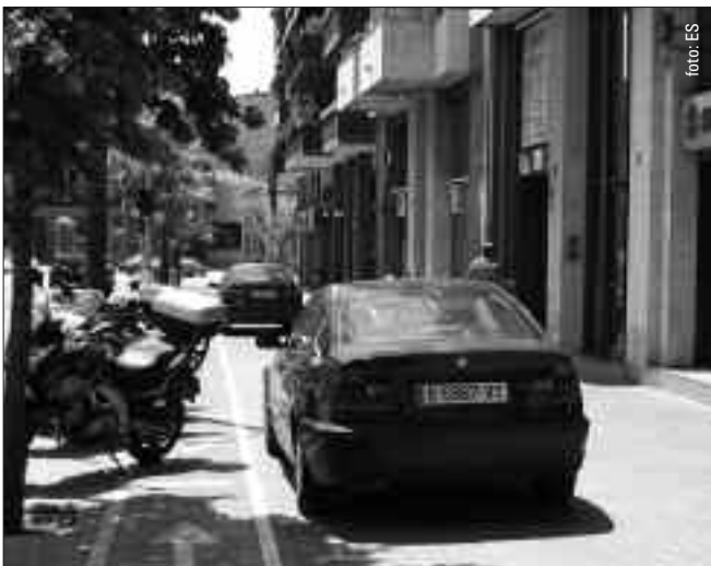
Ronda de Ponent