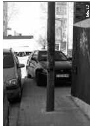
C. dels Montcada