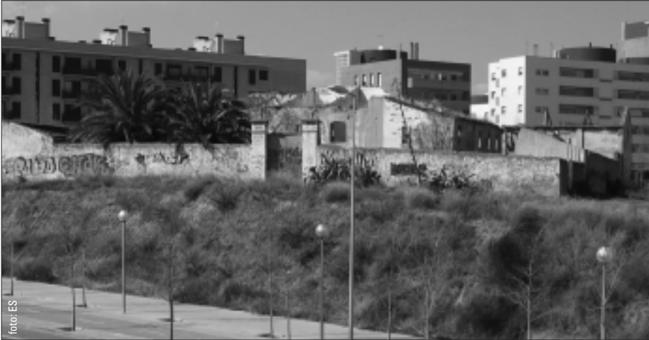
La Masia de Can Llong.

Can Llong és una de les masies més representatives del passat agrícola de Sabadell, un mas del segle XVII que va tenir activitat fins a finals dels anys 70. En les últimes dècades ha sofert un progressiu abandonament i espoliació fins arribar al deplorable estat actual.