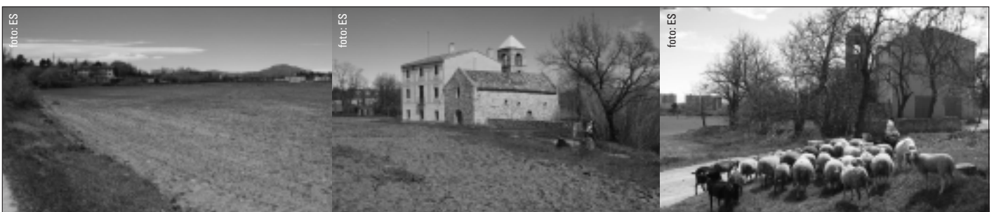
Imatges actuals dels camps de Sant Pau de Riu-Sec.

Per a garantir aquests objectius estratègics defensem una intervenció pública tan en el projecte com en la gestió d'aquest Pla.