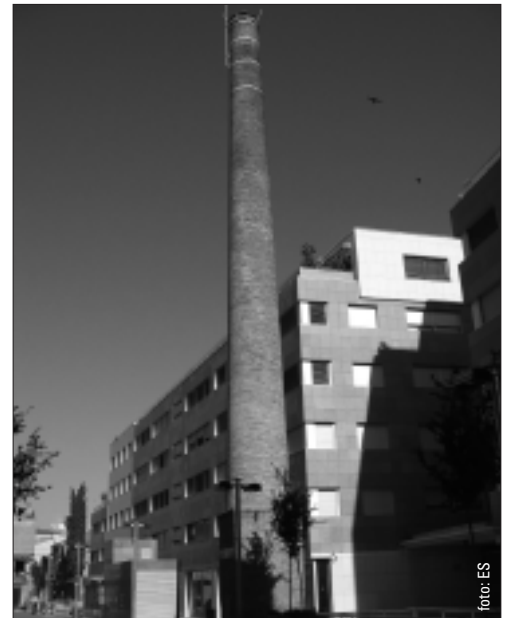
Plaça Joan Olius.