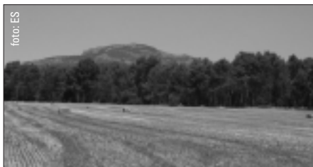
Ple de maig de 2005.

La moció va ser desestimada, amb els vots a favor d'ES i CiU, l'abstenció d' ICV-EA i ERC i els vots en contra de PSC i PP.