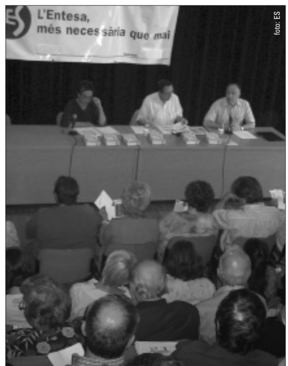
Assemblea de l'Entesa. 31 de maig de 2005.

Finalment, l'Assemblea va valorar positivament l'intens treball portat a terme pel Secretariat, pel Grup Municipal i per tota l'organització.