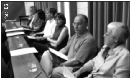
Ple de maig de 2005.

La moció va ser aprovada amb els vots favorables de tots els grups municipals i l'abstenció del PP.