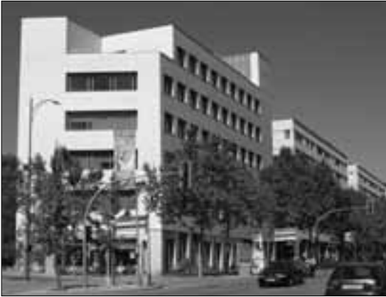
Edifici CESTIC a l'Eix Macià.

En el Ple de juliol el Govern municipal va aprovar, amb el vot contrari de l'Entesa, una moció d'urgència d'alcaldia a favor de la dissolució del CESTIC (Centre d'Estudis i Serveis de i Tecnologies de la Informació i de la Comunicació Avançades).