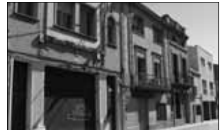
Carrer del Convent.

El govern municipal impulsa el projecte de promoció pública que modifica els paràmetres urbanístics que el Pla General d'Ordenació preveu per a l'illa delimitada pels carrers de Vilarrúbies, del Convent, de Sant Honorat i de la Soledat.