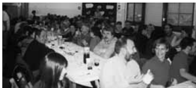
Fons: Entesa per Sabadell

L'acte va afirmar la consolidació de l'Entesa com a alternativa ciutadana per a un Sabadell progressista.