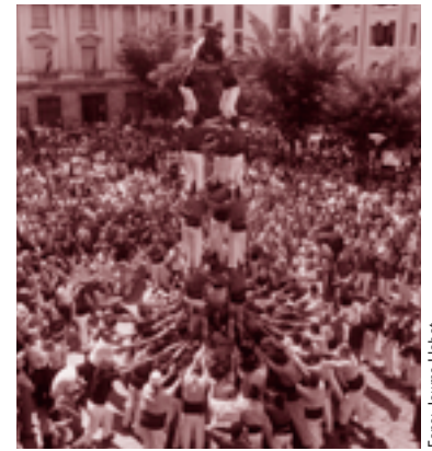
Fons: Jaume Libet

Tot plegat ens hauria de fer reflexionar que la política cultural a Sabadell necessita diàleg i suma d'esforços per assolir un objectiu: "apujar el llistó", i aconseguir una ciutat dinàmica en la producció i en la programació d'espectacles culturals de qualitat.