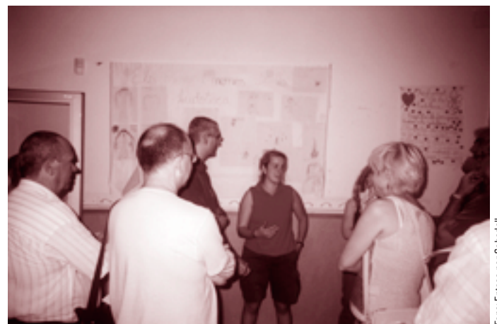
Visita a la ludoteca de Centre Cívic Rogelio Soto

res corresponents per evitar l'impacte de l'Aeroport a la zona. Continuar invertint al Parc Central del Vallès. I, per últim, la necessitat de construir un equipament per a la gent gran al solar previst.