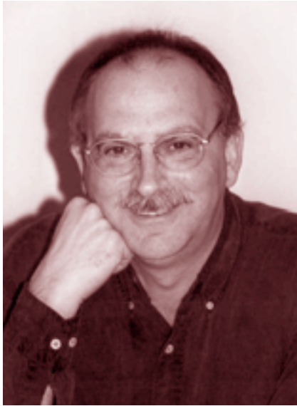
Fons: Entesa per Sabadell