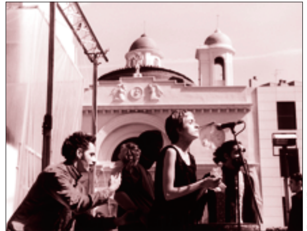
Fons de l'Entesa

Aquests últims anys, Sabadell ha celebrat el Dia de la Dona Treballadora oferint el protagonisme a les associacions de dones de la ciutat. Des de l'Entesa compartim plenament la lluita per la igualtat de gèneres. Però aquest any s'ha de destacar un nombre considerable d'actes organitzats directament des de la Regidoria per a la Igualtat; com ja vam avançar fa un temps l'Ajuntament de Sabadell està esdevenint un ajuntament franquícia; en aquesta ocasió s'ha sumat un pack d'actes de la Diputació de Barcelona com si els 42 actes organitzats per les entitats locals no fossin suficients ni tinguessin prou interès. No hi ha hagut presentació pública conjunta Entitats – Ajuntament; com ja era habitual. On hi havia "foto" només existia l'Ajuntament. A vosaltres què us sembla? La gran participació de què presumeix aquest equip de govern només implica escoltar les entitats (segurament per falta de criteris, de model) o, també caldria compartir-ne la gestió i el protagonisme ?